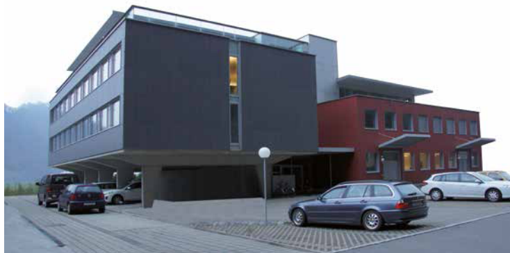
Produktion und Verwaltung