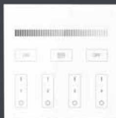
4 Kanal Wandsender Mono