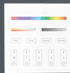
4 Wandsender Mono/RGBW