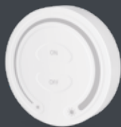
1 Kanal Wandsender Mono