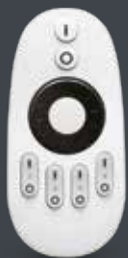
4 Kanal Handsender Mono

Handsender und Wandschalter zum Schalten von Monochromen, RGB und RGBW-Leuchten. Geeignet für Universal-LED-Steuerung und alle RGBW-Steuerboxen.