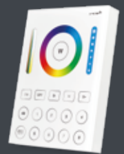
8 Kanal Wandsender RGBW