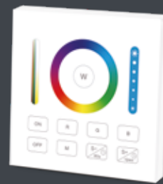
1 Kanal Wandsender RGBW