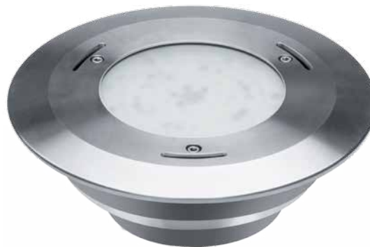
Poolstar super LED HP RGBW multi couleur

Système de connecteur sans fil, imperméable à l'eau. Échange de la lampe sous l'eau dans environ 5 minutes.