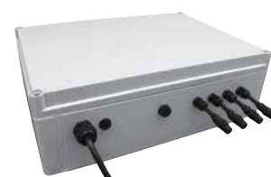
Boite de commande Staub