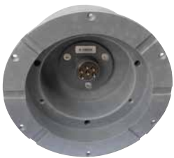
Boitier de montage avec prise

SYSTÈME DE CONNECTEUR Brevet Suisse enregistré DE modèle d'utilité