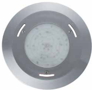
Poolstar super, vue frontale