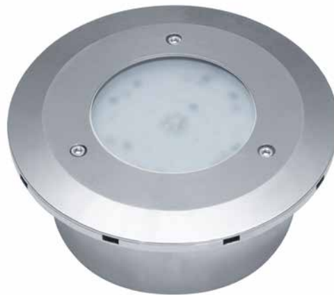
Poolstar LED HP RGBW multi couleur

Système de connecteur sans fil, imperméable à l'eau. Échange de la lampe sous l'eau dans environ 5 minutes.