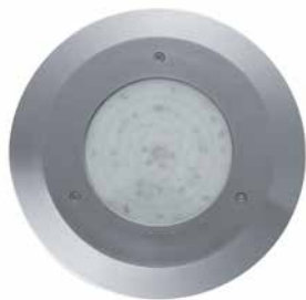
Poolstar LED HP, vue frontale