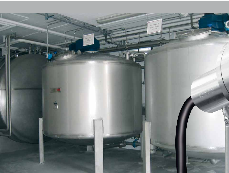
Réservoirs de magasin et laboratoire

Gigaspot-Ex LED HP, monté sur le support de lampe moyen