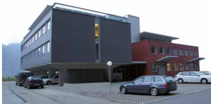
Produktion und Verwaltung