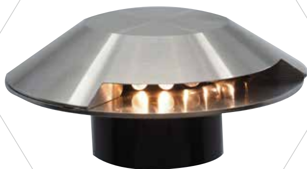
Winkelspot Effekt 1-fach Edelstahl

Der Winkelspot Effekt punktet dank seiner niedrigen Einbautiefe und den feinen Lichtlinien, die er entstehen lässt!