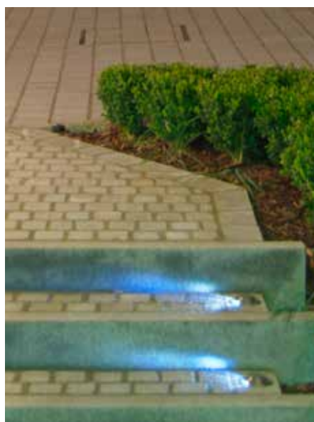
Winkelspot Effekt 1-fach Stufenbeleuchtung