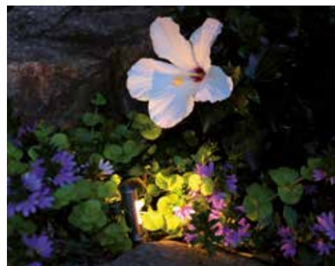
Stableuchte, für faszinierende Lichtakzente