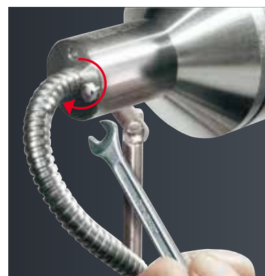
Unkomplizierte Befestigung der Leuchtenhalter

Ring-Gabelschlüssel 7 mm zum Befestigen der Leuchte am Leuchtenhalter